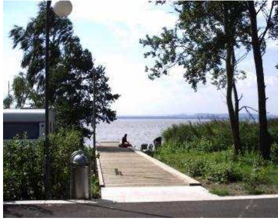
Sehsteg Lüttjen Mardorf