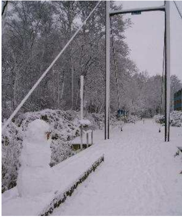
Sehbrücke im Winter