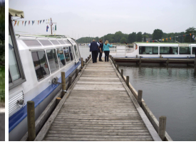
Steg N43 am Pilz