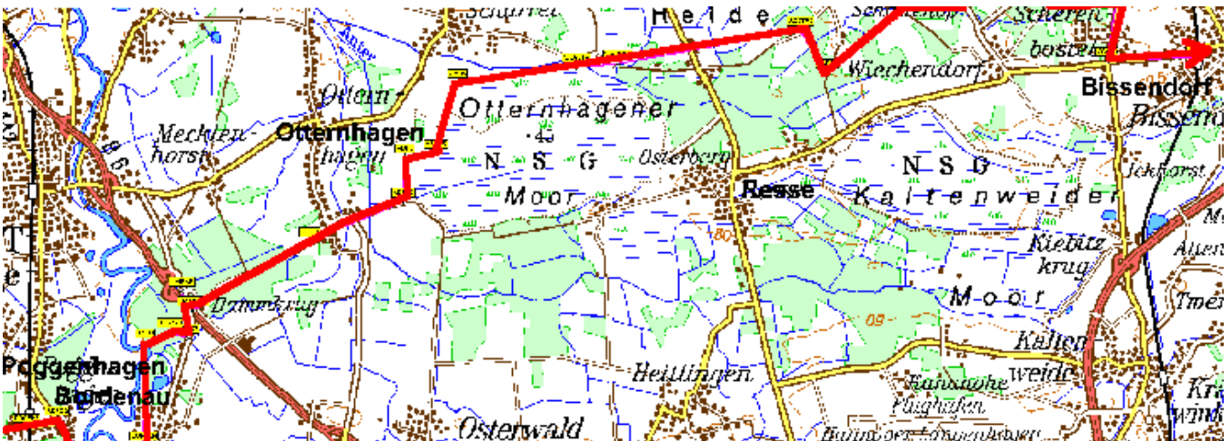
Etappe 27 (Bissendorf-Poggenhagen)