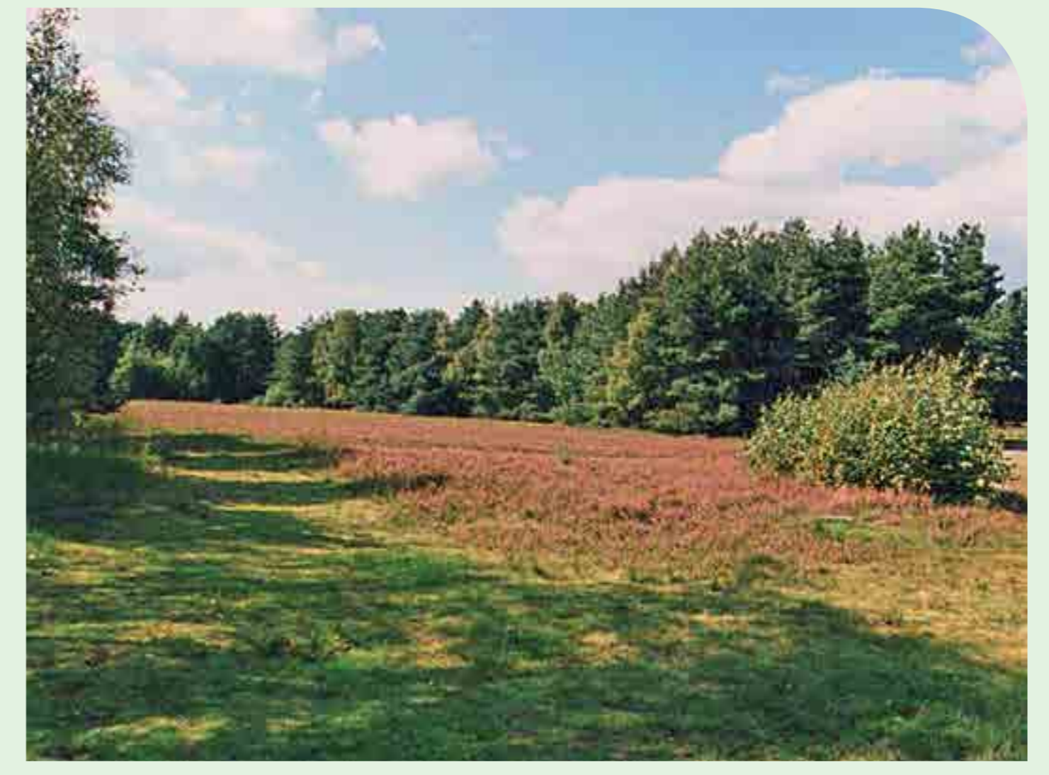
Heide am ehemaligen Bannsee nordöstlich von Mardorf