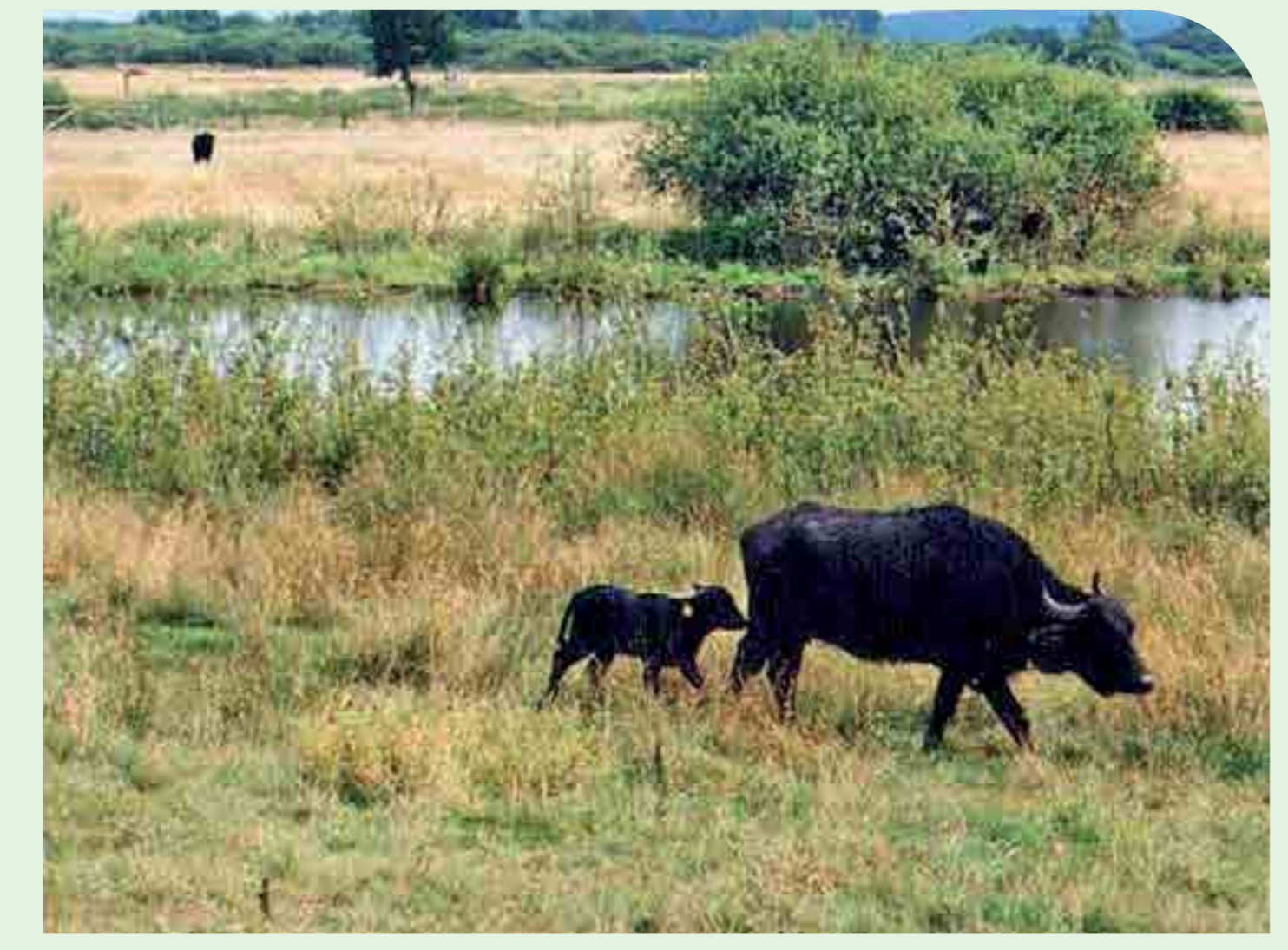
Meerbruchwiesen im Westen Mardorfs