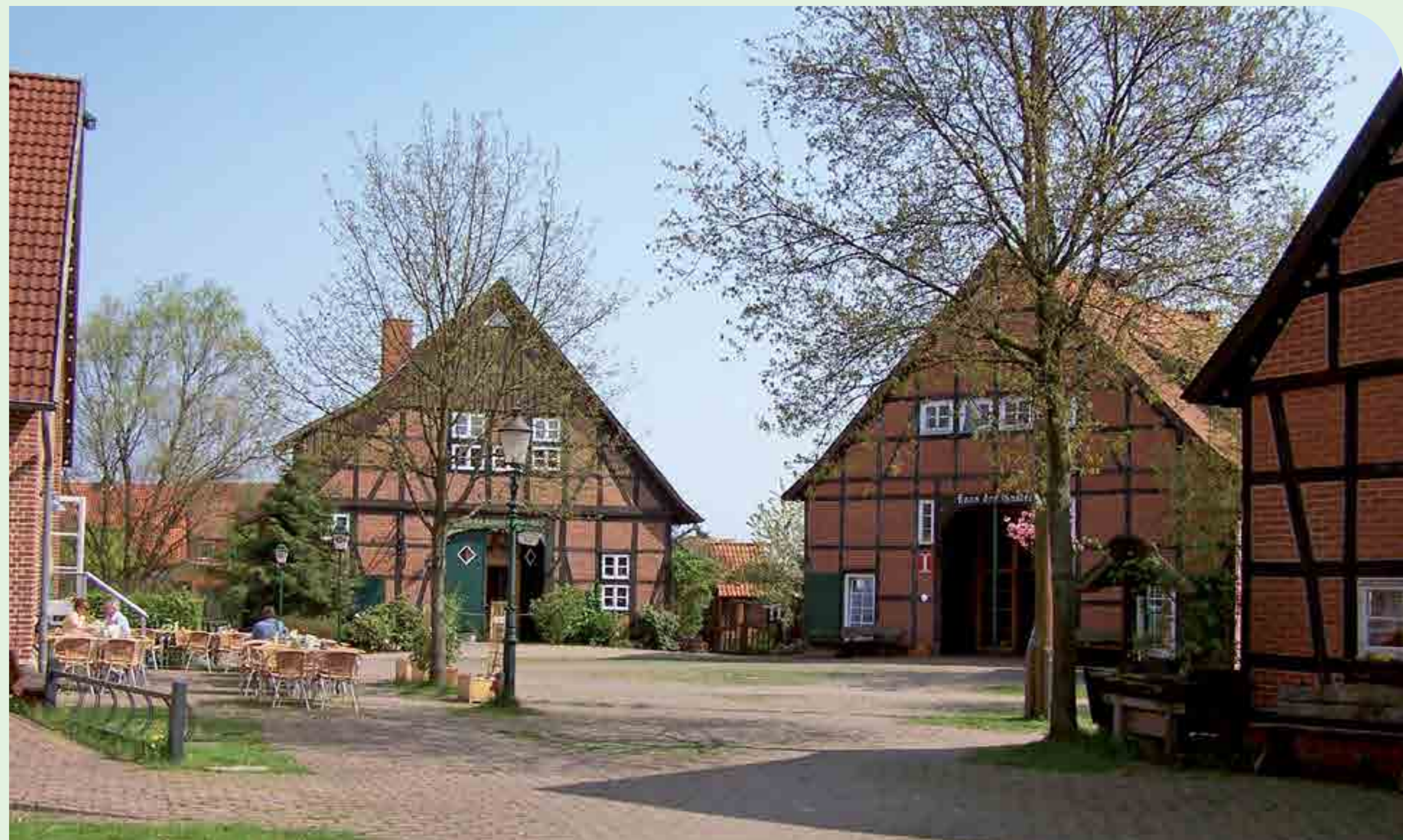
Aloys-Bunge-Platz in der Ortsmitte