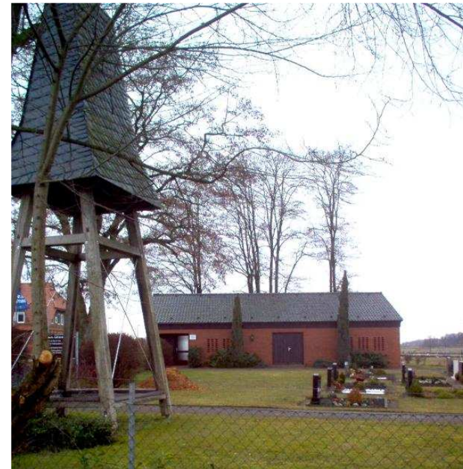
Glockenturm von 1990 und Friedhofskapelle von 1983