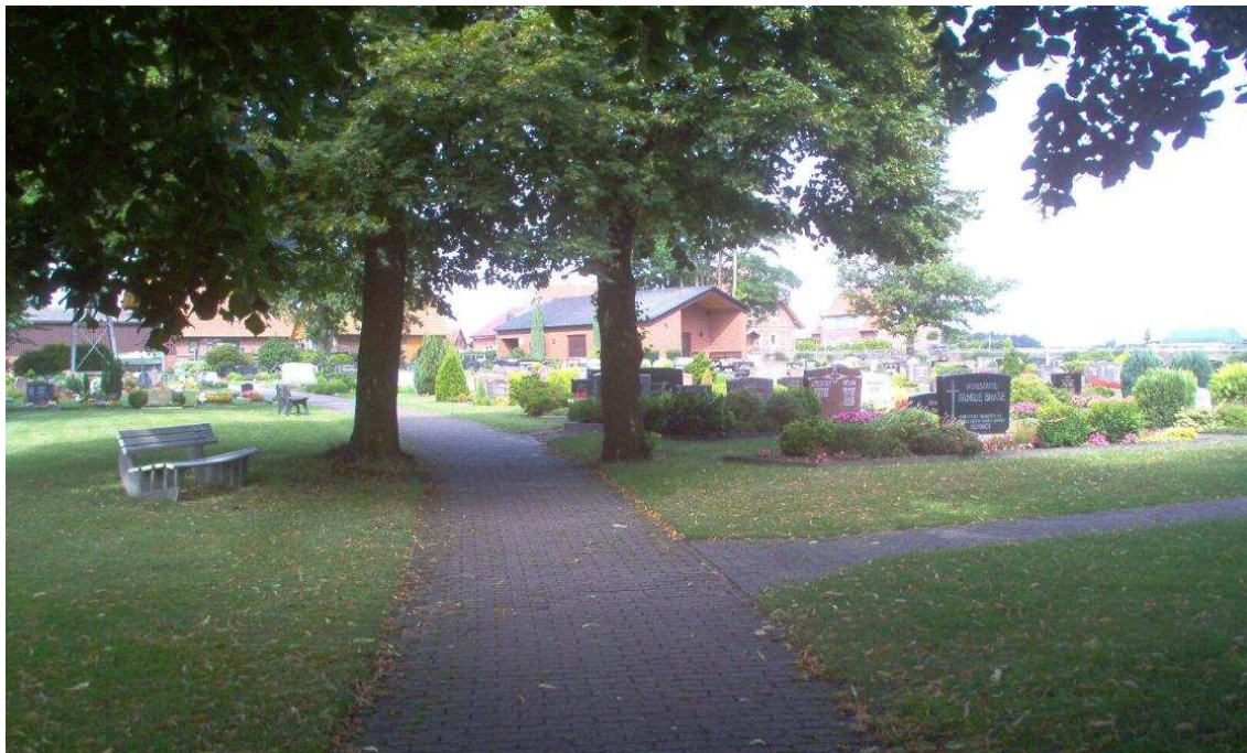
Neuer Friedhof seit 1840 (vom „ Pastor-Lunde-Weg “ her)