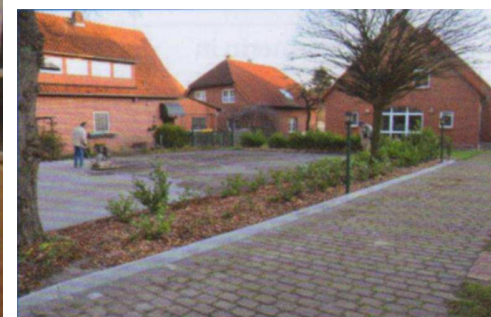
Ev.-luth. Gemeindehaus von 1994 (auf dem ehemaligen alten Friedhof von 1801). 2011 weihnachtliche Innenansicht und neue Zufahrt / Aloys-Bunge-Platz zum Gem.Haus